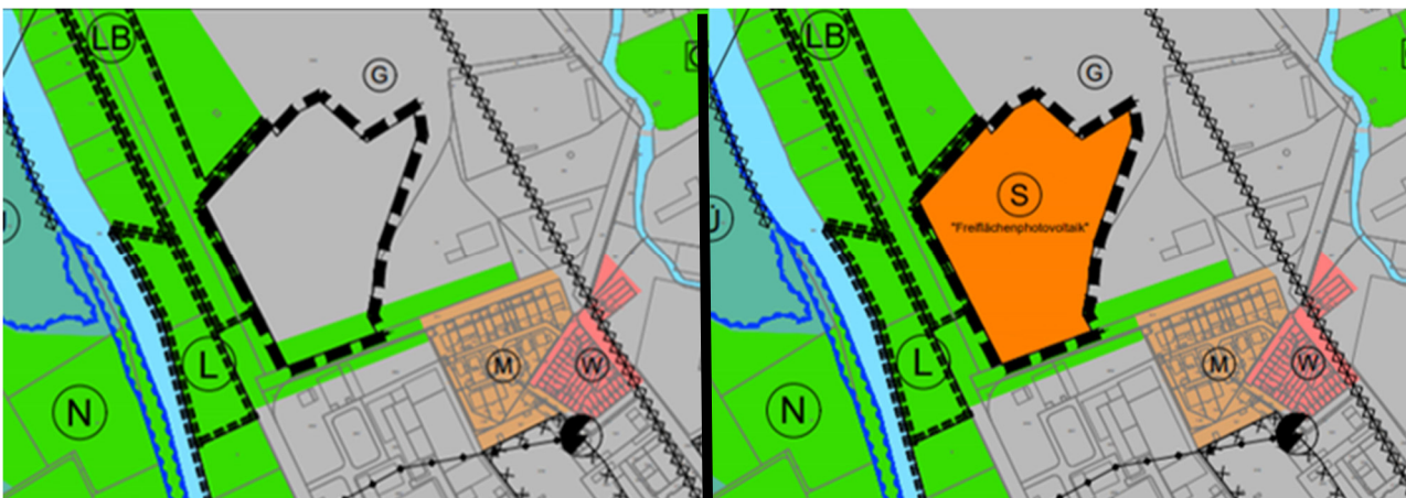
Abbildung 2: bisherige Darstellung des Flächennutzungsplanes des rechtskräftigen Flächennutzungsplanes (links); geplante Darstellung des Flächennutzungsplanes nach der 54. Änderung (rechts)

Der räumliche Geltungsbereich umfasst Flächen in der Gemarkung Düren, Flur 38 und hat eine Größe von ca. 3,5 ha. Derzeit wird das Plangebiet nahezu vollständig ackerbaulich genutzt. Im Süden grenzt das Plangebiet an die Rurstraße, zu allen anderen Seiten ist es durch Baum- und Gebüschbereiche eingegrünt. Die Gehölzstrukturen werden von der Planung nicht berührt, es werden ausschließlich landwirtschaftliche Flächen in Anspruch genommen. Im näheren Umfeld schließen nach Süden und Osten unmittelbar Gewerbe- und Industrieflächen an. Die Betriebsbereiche der Reflex GmbH & Co. KG befinden sich nordöstlich. Weiterhin liegt im Osten ein Sportgelände. Südöstlich befindet sich in ca. 70 m Entfernung eine Wohnlage. Nach Norden und Westen befinden sich größere Grünbereiche. Auch an diese schließen sich industriell genutzte Fläche der Ortslagen Mariaweiler und Gürzenich an.