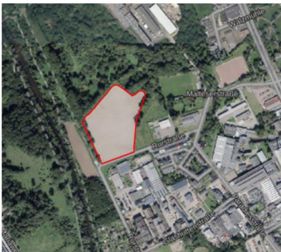
Abbildung 1: Plangebiet im aktuellen Luftbild (2023)

Der räumliche Geltungsbereich umfasst Flächen in der Gemarkung Düren, Flur 38 und hat eine Größe von ca. 3,5 ha. Derzeit wird das Plangebiet nahezu vollständig ackerbaulich genutzt. Im Süden grenzt das Plangebiet an die Rurstraße, zu allen anderen Seiten ist es durch Baum- und Gebüschbereiche eingegrünt. Die Gehölzstrukturen werden von der Planung nicht berührt, es werden ausschließlich landwirtschaftliche Flächen in Anspruch genommen. Im näheren Umfeld schließen nach Süden und Osten unmittelbar Gewerbe- und Industrieflächen an. Die Betriebsbereiche der Reflex GmbH & Co. KG befinden sich nordöstlich. Weiterhin liegt im Osten ein Sportgelände. Südöstlich befindet sich in ca. 70 m Entfernung eine Wohnlage. Nach Norden und Westen befinden sich größere Grünbereiche. Auch an diese schließen sich industriell genutzte Fläche der Ortslagen Mariaweiler und Gürzenich an.